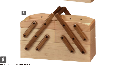
8 ストレージBOX W350×D175×H240 ¥30,400 才数1

材質/メーブル 塗装/ラッカー塗装 カラー/ナチュラル ●引出し三方組 ●中国製