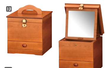
13 メーキャップBOX W240×D235×H250(ハンドルまでH305) ¥39,000 才数1