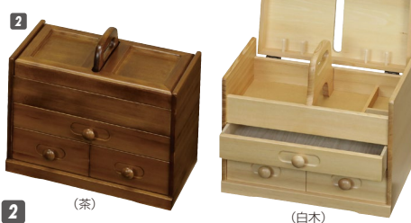
2 ソーイングBOX W325×D160×H280 引出し内寸:W285×D185×H41 ¥45,400 才数1