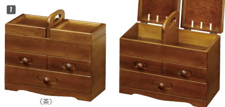
1 ソーイングBOX W350×D180×H265 引出し内寸:W285×D185×H41 ¥51,700 才数1