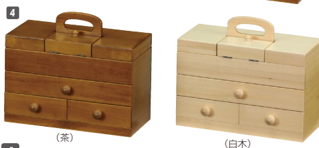
4 ソーイングBOX W325×D160×H280 引出し内寸:W285×D185×H41 ¥42,000 才数1