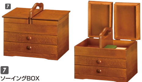
7 ソーイングBOX W325×D220×H235(ハンドルまでH290) 引出し内寸:W285×D185×H41 ¥40,400 才数2