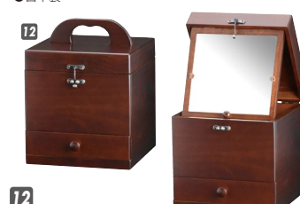
12 メーキャップBOX W230×D220×H245(ハンドルまでH300) 抽斗内寸:W265×D13×上H50・下H60 ¥33,400 才数1

材質/オーク 塗装/ウレタン塗装 カラー/オーク ●引出し三方組 ●鏡角度調整できます ●引出しは落下防止機能付 ●日本製