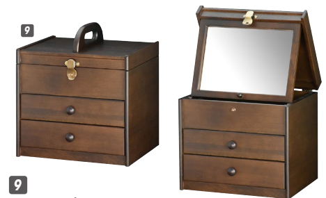
9 メーキャップBOX W300×D250×H280(ハンドルまでH335) 抽斗内寸:W265×D13×上H50・下H60 ¥47,400 才数2

材質/オーク 塗装/ウレタン塗装 カラー/オーク ●引出し三方組 ●鏡角度調整できます ●引出しは落下防止機能付 ●日本製