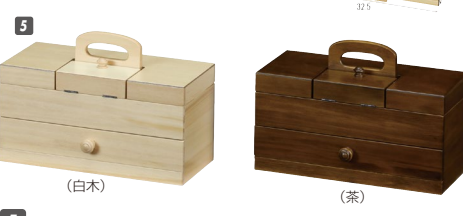
5 ソーイングBOX W325×D220×H235 引出し内寸:W285×D185×H41 ¥38,400 才数2