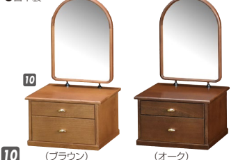
10 ミニドレッサー W240×D210×H155(AH445) 抽斗内寸:W185×D145×上H30・下H60 ¥41,400 才数1

材質/オーク 塗装/ウレタン塗装 カラー/ブラウン・オーク ●引出し三方組 ●鏡角度調整できます ●鏡寸法W180×H255 ●日本製