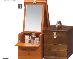
11 コスメBOX W235×D300×H250(ハンドルまでH310) ¥43,000 才数1

材質/栓 塗装/ウレタン塗装 カラー/ライトブラウン・ダークブラウン ●引出し三方組 ●ミラー寸法W150×H235 ●日本製