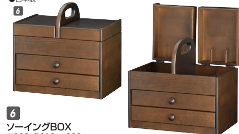
6 ソーイングBOX W320×D210×H300 引出し内寸:W285×D165×上H35・下H4 ¥42,400 才数1

材質/ロオーク 塗装/ウレタン塗装 カラー/オーク色 ●引出し三方組 ●落下防止機能付 ●上部内寸:W255×D手前65奥21 ●日本製