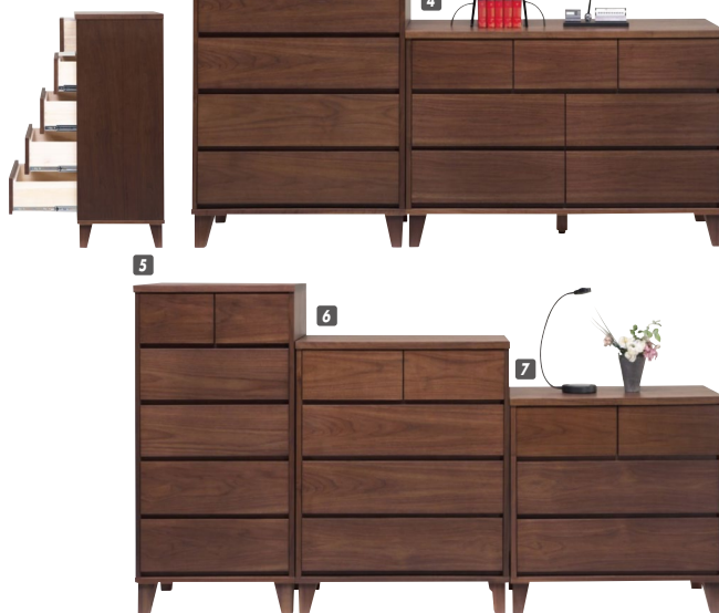
7 チェスト80-3 W800×D450×H760(120) ¥75,000 才数11