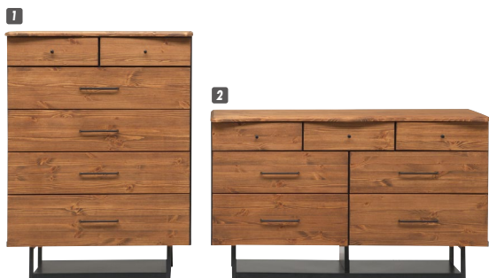
1 チェスト80-5 W800×D450×H1070 ¥139,400 才数15