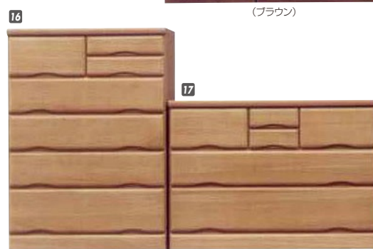
16 ハイチェスト80 W800×D405×H1115 ¥44,000 才数14