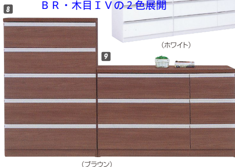
8 ハイチェスト80 W800×D450×H1210 ¥38,400 才数17

後継品「サニー」 アルミ取手から、アゴ引手に変更 前板強化紙貼から、塩ビ貼に変更 BR・木目IVの2色展開