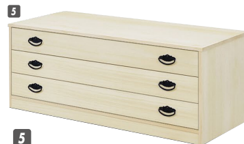
5 総桐チェスト(TO-3)100-3 W1000×D440×H390 ¥47,400 才数8