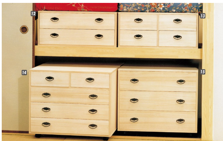
15 桐押入タンス(ROT-3)75-3 W750×D750×H650 ¥83,400 才数14