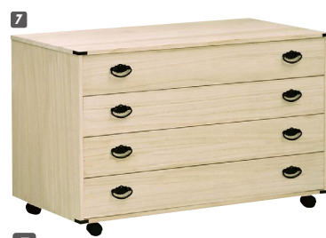
7 総桐衣装チェスト(650B)4段 W1000×D440×H615 ¥67,700 才数11