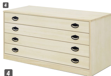
4 総桐チェスト(TO-4)100-4 W1000×D440×H500 ¥61,400 才数10