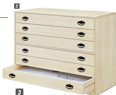
3 総桐チェスト(TO-6)100-6 W1000×D440×H720 ¥81,000 才数14