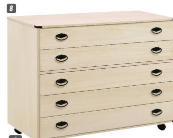
8 総桐衣装チェスト(650BS)5段 W1000×D440×H760 ¥80,000 才数14