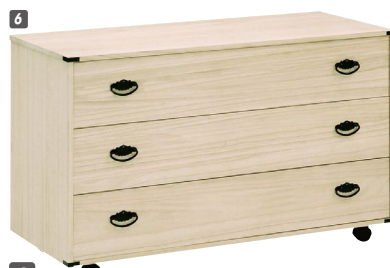
6 総桐衣装チェスト(650A)3段 W1000×D440×H615 ¥62,700 才数11