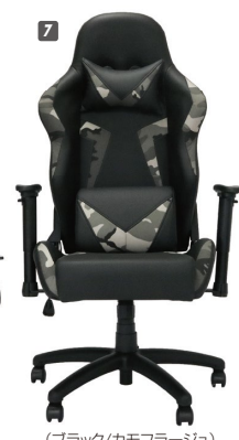
(ブラック/カモフラージュ)

7 ゲーミングチェア W660×D700~1150×H1215~1295(SH455~535) ¥57,700 才数8