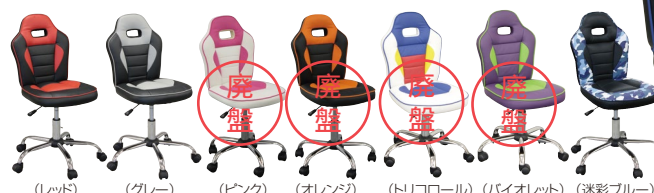
(レッド) (グレー) (ピンク) (オレンジ) (トリコロール) (バイオレット) (迷彩ブルー)