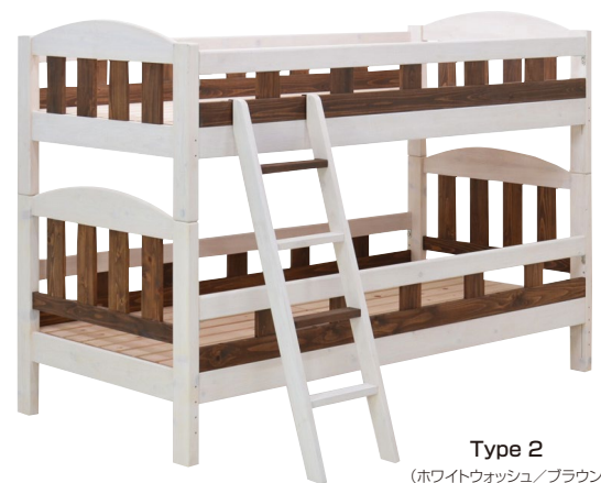
Type 2 (ホワイトウォッシュ/ブラウン)